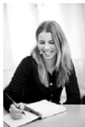
- Bachelor i engelsk - Afleveret speciale i 2004 - Fastansat i 2005 som redaktør og i 2007 som redaktionschef hos Netdoktor Media (en del af Berlingske Media)

- Ansvarsområder: Ledelse af redaktionen samt ansvar for indhold og udvikling på www.netdoktor.dk