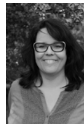
- Bachelor i dansk - Afleveret speciale i 2012 - Ansat i feb. 2013 som forskningsassistent i Forskningsenhed for Almen Praksis, København

- Ansvarsområder: Jeg forbereder ph.d.-forløb inden for implementeringsforskning. Jeg skal undersøge implementeringen af en ny måde at organisere behandling af angst og depression på i almen praksis (dvs. hos de praktiserende læger).